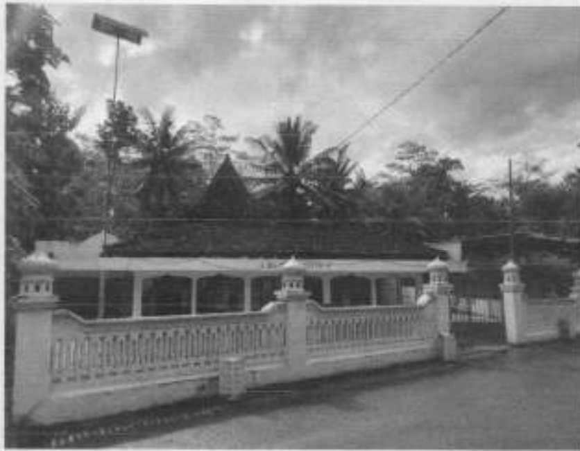
Gambar 1: Tampak Depan