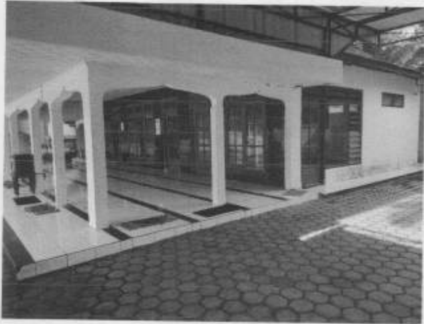
Gambar 3: Tampak Samping Kanan