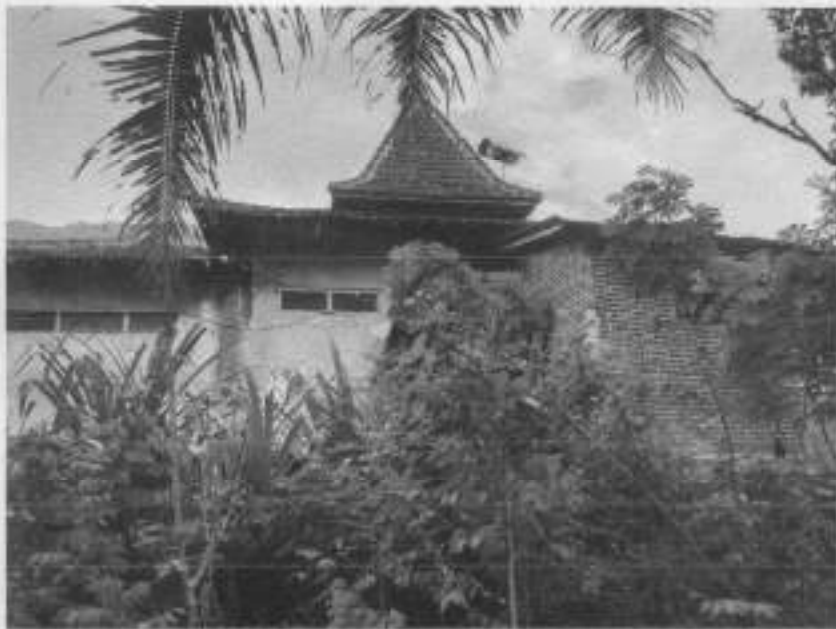
Gambar 2: Tampak Belakang