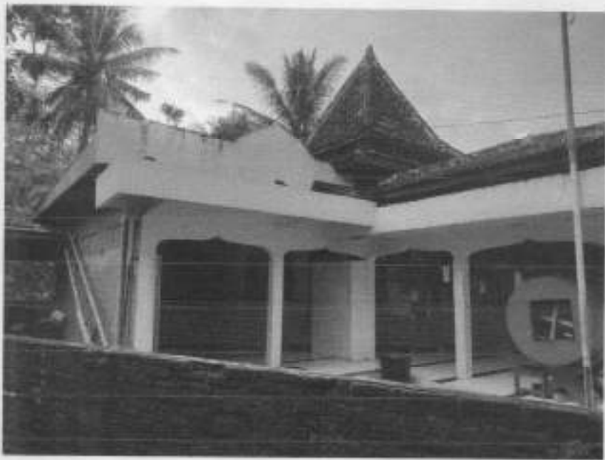
Gambar 4: Tampak Samping Kiri