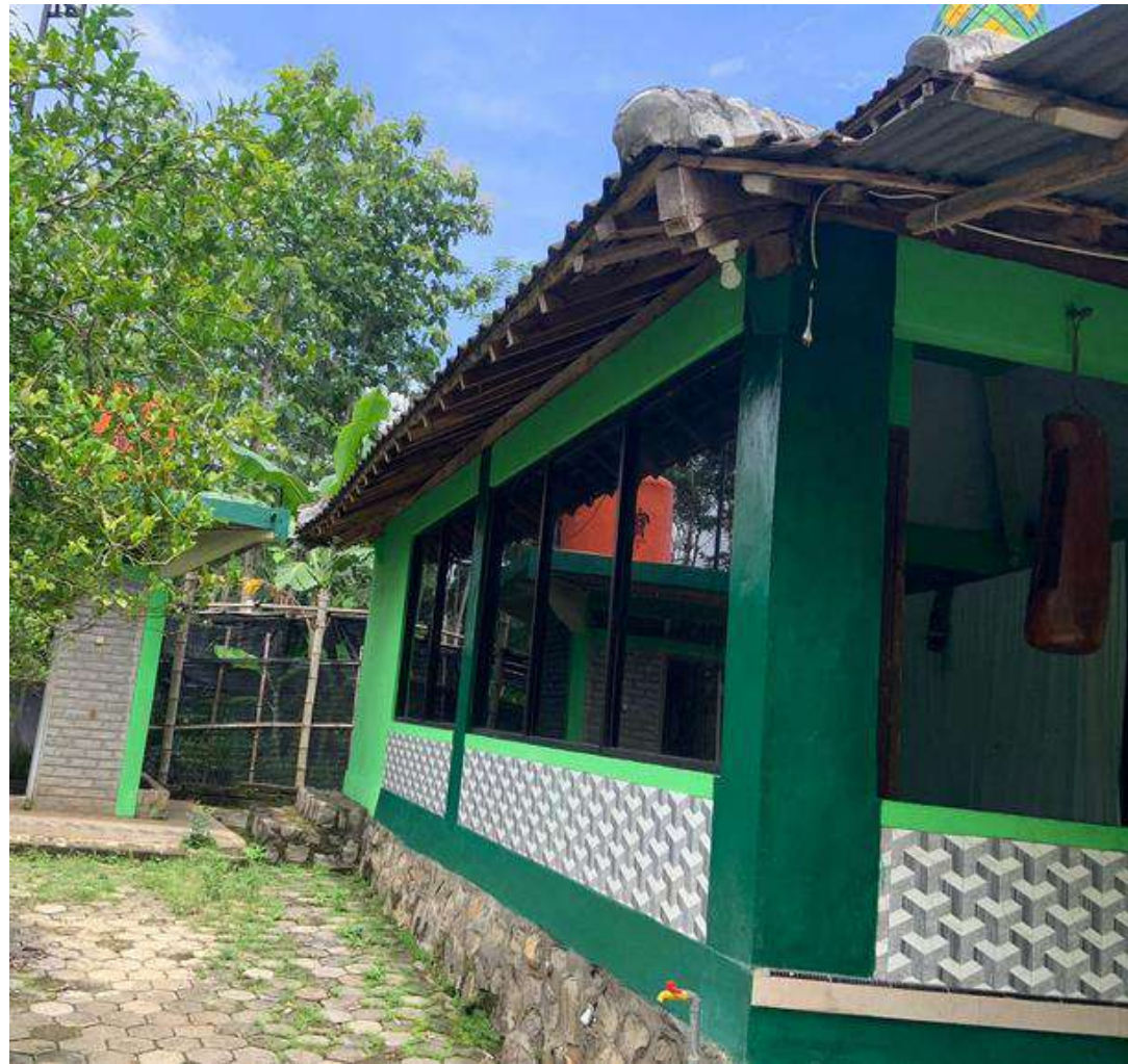
FOTO TAMPAK SAMPING KIRI