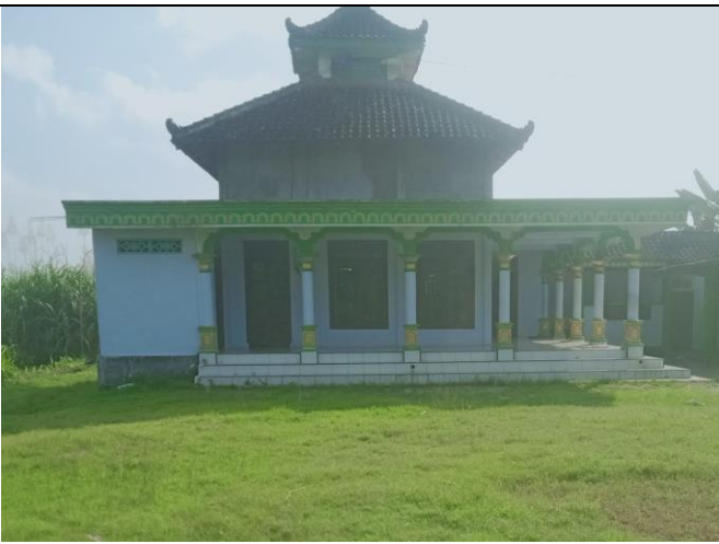
FOTO TEMPAT WUDHU