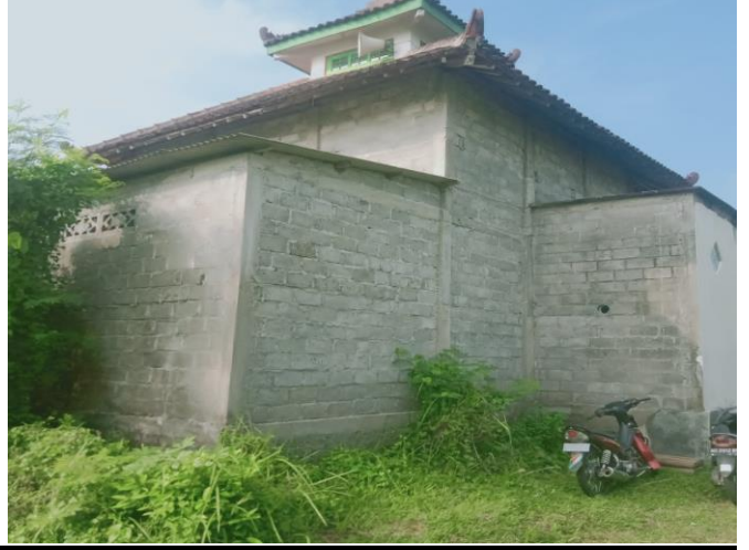
FOTO TEMPAT SEPEDA