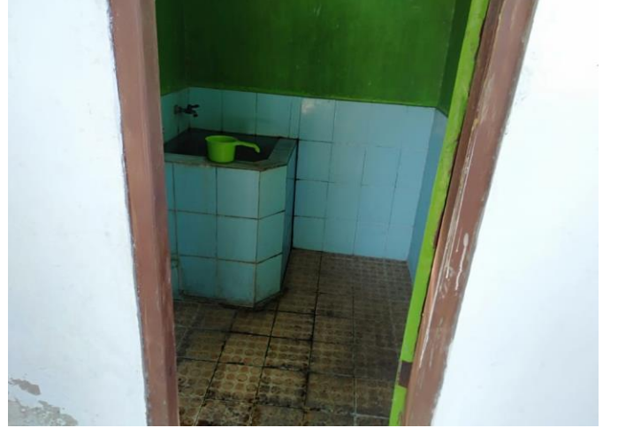
FOTO TAMPAK SAMPING